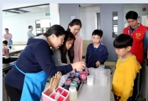
创“皂”美好，创“皂”快乐