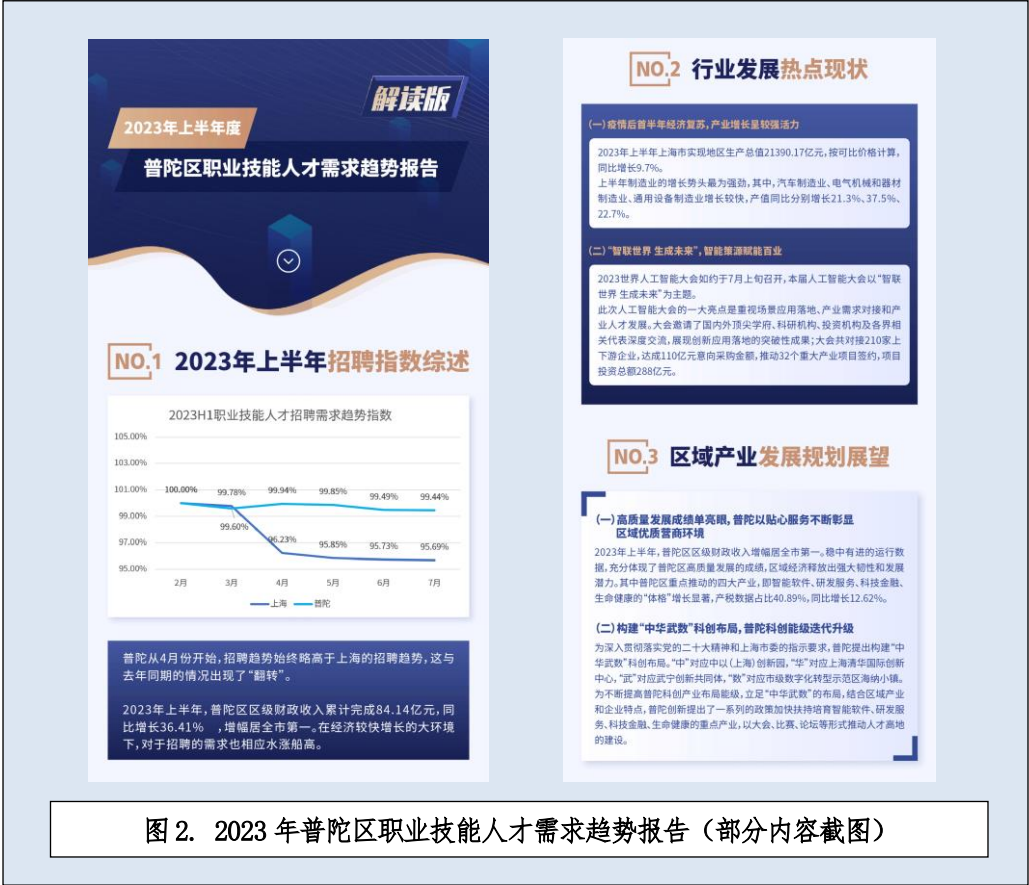
图 2. 2023 年普陀区职业技能人才需求趋势报告（部分内容截图）

上海信息技术学校组织的智能机器人职业教育集团共有成员单位 79 家，其中企业 40 家，中高职院校 36 家，行业组织 2 家，科研机构 1 家，分布以上海市为主，并辐射全国 8 个省市，实现了职业教育的跨域合作。作为化工职业教育集团理事长单位，上海信息技术学校凭借自身在信息采集、跟踪、筛选和发布的优势，并通过自有网站、企业微信群等信息交互平台，化工职教集团有序推进集团信息和课程资源的共聚与共享，提高集团资源的利用效率。