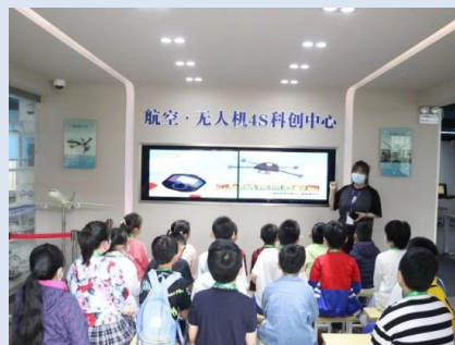
无人机职业体验活动

上海信息技术学校聚焦专业特色，将专业学科与体验活动结合起来，针对不同学段的学生，开设走进商品展示的艺术、体验直播电商、机甲机器人编程、自制感应垃圾桶、平面构成、扫地机器人 DIY、创“皂”美好，创“皂”快乐、彩色叶脉书签的制作 7 个现场体验项目和“人工智能工程师-人脸识别”1 个线上体验项目。