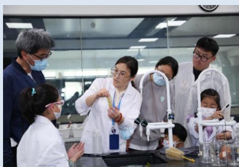
实验操作岗位体验

上海信息技术学校聚焦专业特色，将专业学科与体验活动结合起来，针对不同学段的学生，开设走进商品展示的艺术、体验直播电商、机甲机器人编程、自制感应垃圾桶、平面构成、扫地机器人 DIY、创“皂”美好，创“皂”快乐、彩色叶脉书签的制作 7 个现场体验项目和“人工智能工程师-人脸识别”1 个线上体验项目。