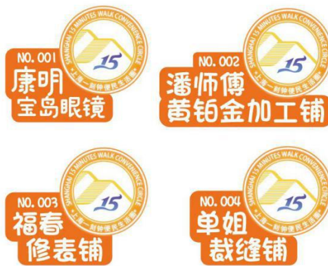
图 2 一刻钟便民生活圈特色标识