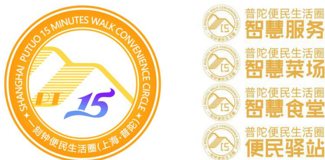
图 1 一刻钟便民生活圈标识