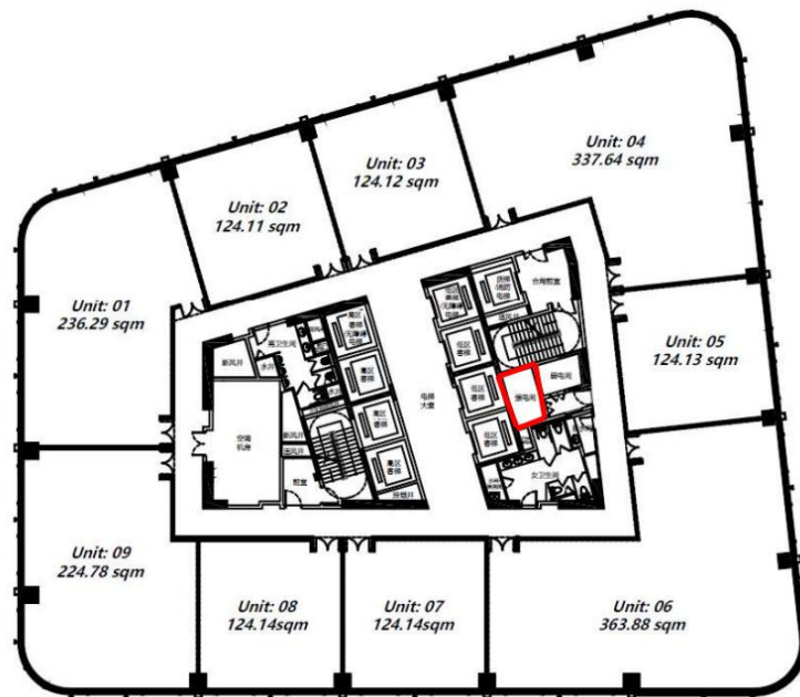
图1 事故现场示意图（红框为事发配电间）

事发配电柜门呈开启状态，旁边有一黄色人字梯，配电柜上方线缆尚未全部从桥架中接入至配电柜，配电柜下方有4组线缆被拽出。（图2）