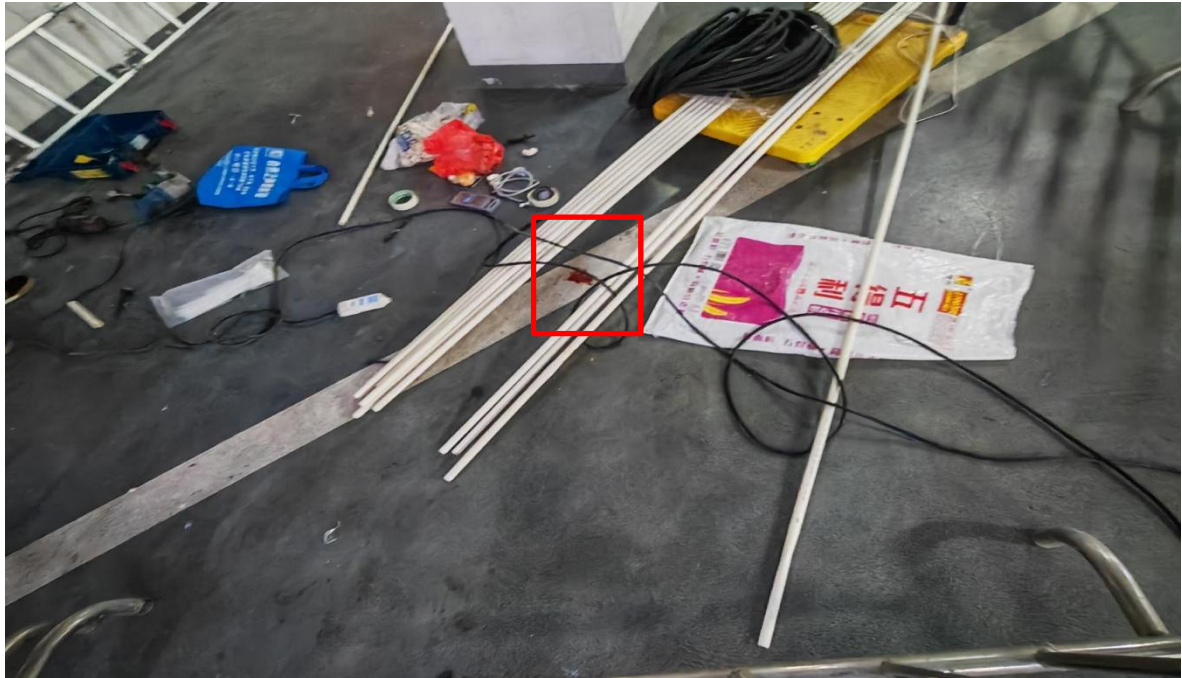
图4 坠落点周边情况图

触电坠落点位于桥架下方，有一滩约 3cm*3cm 的血迹，地面放有电钻及 PVC 管、胶带、膨胀螺丝、扎带等材料（图四）。