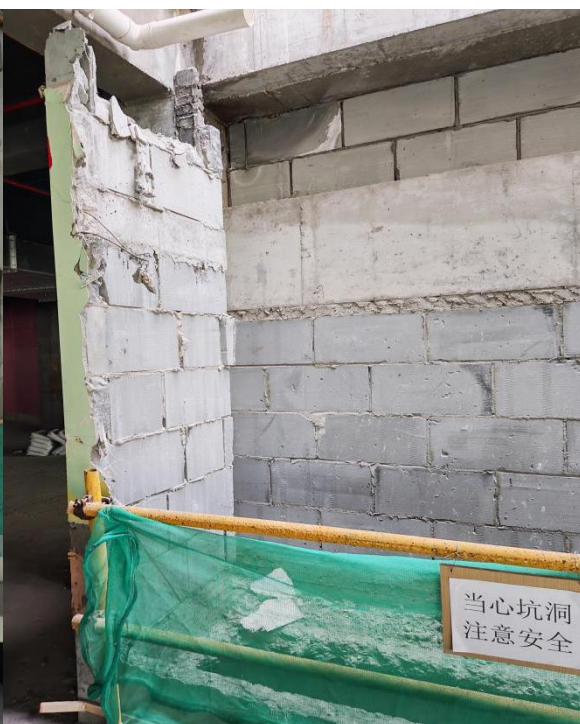
图 2 三楼围栏图