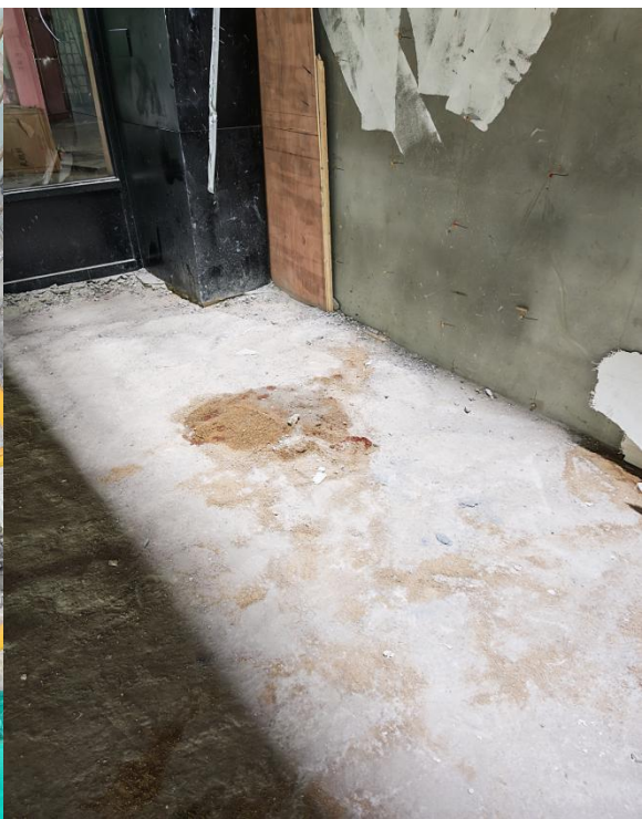
图 4 坠落点周边情况图