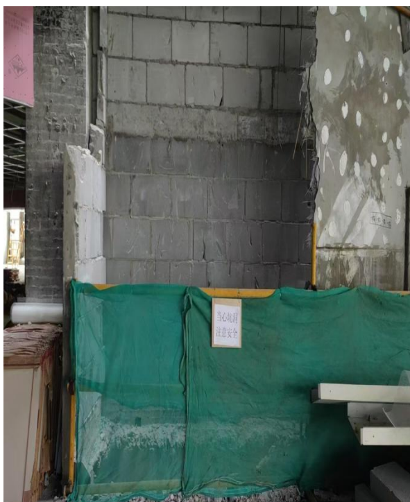
图 1 二楼围栏图