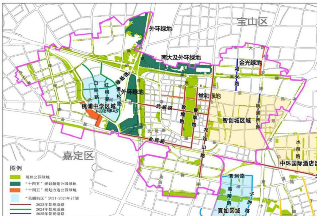
图 2 “十四五”桃浦镇绿化建设项目图

持续推进美丽街区建设。 推动实施桃浦中学区域“美丽街区”建设。实施敦煌路、白丽路、桃浦西路等 11 条景观道路建设。统筹绿化景观、建筑立面、城市家具、店招店牌等要素，加大户外设施和非广告设施的监管整治力度，积极推进“路长制”，加大市容管理的法治化、常态化。着力提升河滨景观，推动亲水平台、景观灯光建设。推进垃圾分类工作常态化、长效化、规范化。持续开展扬尘防治工作，月平均降尘量达到全区考核标准。