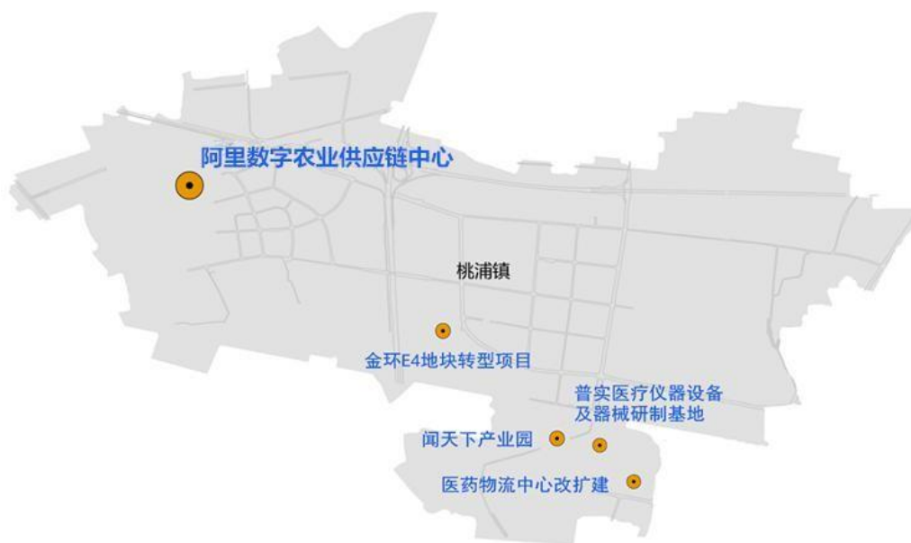
图1 “十四五”桃浦镇产业项目布局图